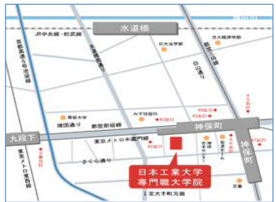
～会場地図、アクセス～